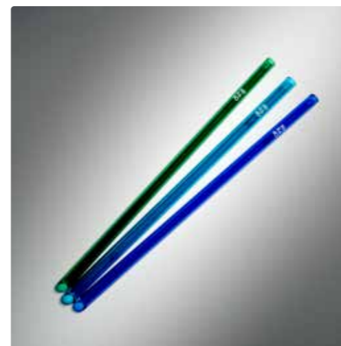
Dall'alto in senso orario. Le Murano Straws in diversi colori. Nella pagina a fianco, da sinistra. Una fase della lavorazione nella fornace di Murano; degustazione di un cocktail.

Non si tratta solo di un accessorio elegante e sostenibile ma anche di uno strumento di marketing e promozione per hotel e ristoranti, da utilizzare come cadeau